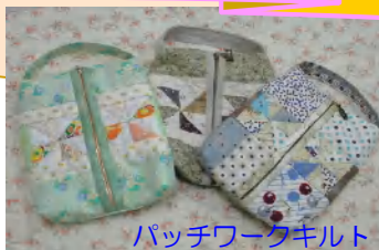
パッチワークキルト