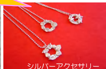
シルバーアクセサリー