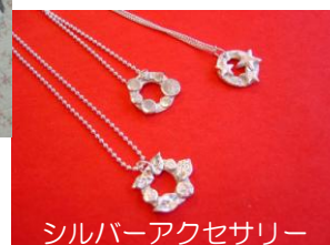
シルバーアクセサリー

★印は生徒さん募集中です。レッスン参加のお申し込み・お問い合わせは下記までどうぞ。