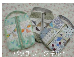
パッチワークキルト